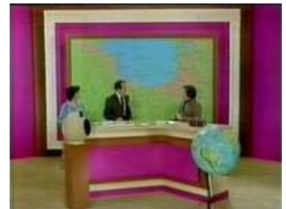
Décor de Pierre Bernard