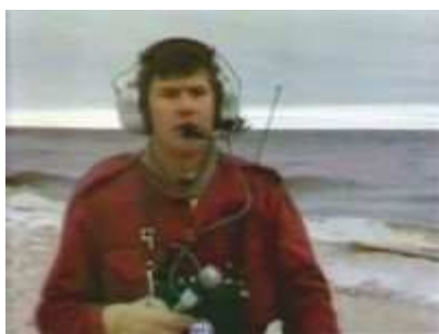
Au départ de l'émission, à l'île des Desbiens, où il fait -10 °