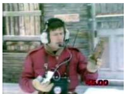
Une statuette porc-épic