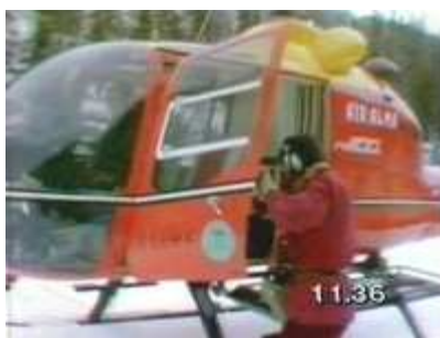
Fairchild Hiller 1100 immatriculé C-GUMK, appartenant à Air Alma, "Les hélicoptères du Lac St Jean"